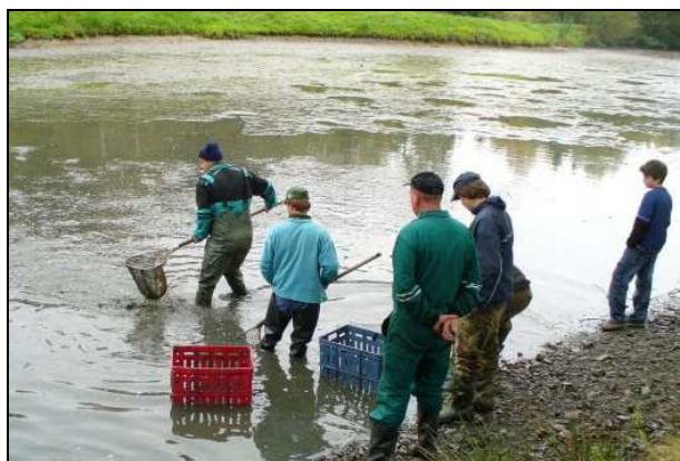
Fotografie z výlovu rybníku ve Vítovicích 10.10. 2009.