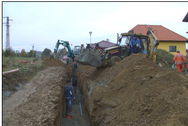
V současné době probíhají práce na ZTV za hřištěm.