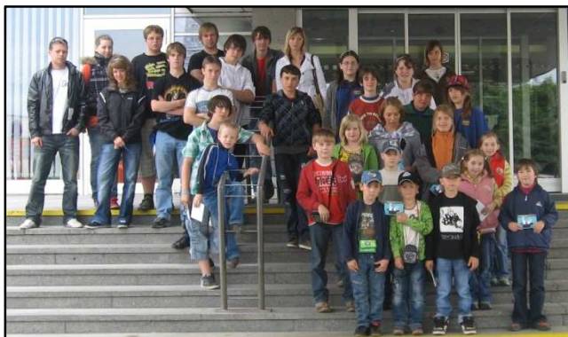
Před Českou televzí

Měli jsme málo času a tak nezbývalo než se vydat rovnou na letiště Praha – Ruzyně. Po příjezdu nás uvítala paní, která nás měla provést celým letištěm. Promítla nám film o nové výstavbě paralyzované dráhy, která by měla začít fungovat v roce 2014. Poté jsme nastoupili do speciálního autobusu a vyrazili na letištní dráhu. Viděli jsme mnoho zajímavých věcí od hangárů až po letadla.